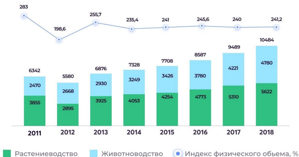
Диаграмма 1. Динамика производства в сельском хозяйстве в (млн. $)

По оценкам специалистов, сельскохозяйственная отрасль Казахстана обладает высоким экспортным потенциалом, на что указывают следующие преимущества: